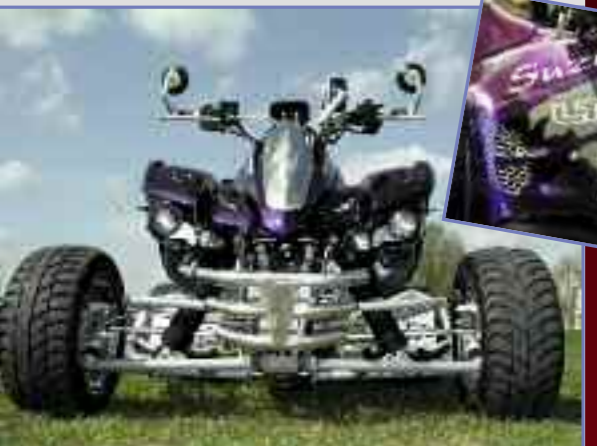
Eisen Michel: 5 cm Bodenfreiheit zum Kurvenrübern