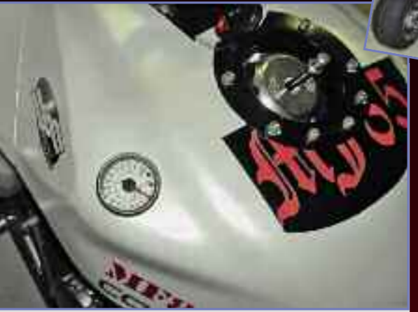
KjuseL: waschechter Streetfighter