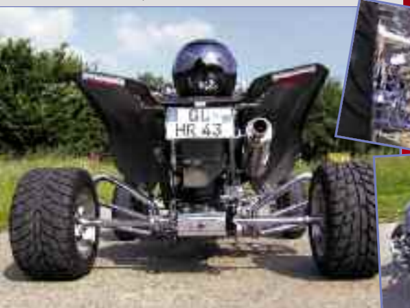
Halli: nicht geizig mit Chrom und Zubehör