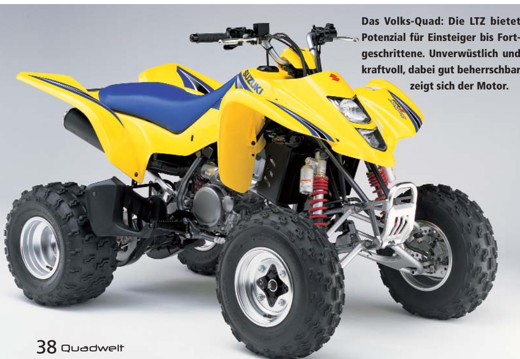
Das Volks-Quad: Die LTZ bietet Potenzial für Einsteiger bis Fortgeschrittene. Unverwüstlich und kraftvoll, dabei gut beherrschbar zeigt sich der Motor.

gebracht. Die Modelle K5 und K6 hatten teilweise ein massives Problem mit dem Wasserpumpendeckel, der aus einer Legierung bestand, die vom Kühlmittel angegriffen wurde. Da zu diesem Zeitpunkt noch alle LTZ Modelle in Deutschland so genannte "Graue" waren, hatte der ein oder andere Besitzer ein echtes Problem, einen Gewährleistungsanspruch geltend zu machen. Die Kulanz der meisten Händler hat aber gegriffen, so dass es kaum zu größeren Schäden kam. Trotz heute wesentlich größerer Auswahl in dieser Klasse, stellt die Suzuki noch immer ein gerne genommenes Angebot dar. Die LTZ 400 ist quasi der Golf unter den Quads.